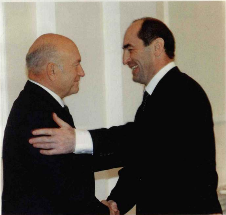
Մոսկվայի քաղաքապետ Յուրի Լուժկովի հանդիպումը ՀՀ նախագահ Ռոբերտ Բոչարյանի հետ