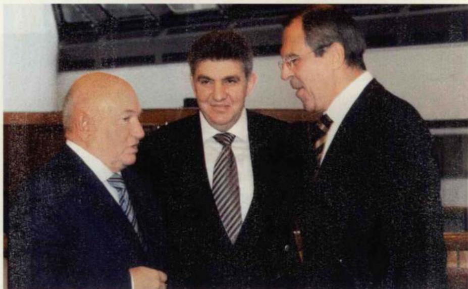
Մոսկվայի քաղաքապետ Յուրի Լուժկովը (ձախից), Ռուսաստանի հայերի միության և Համաշխարհային հայկական կոնգրեսի նախագահ Արա Աբրամյանը, ՌԴ արտաքին գործերի նախարար Սերգեյ Լավրովը