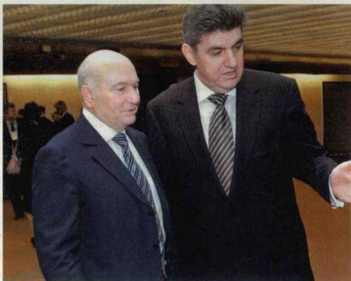
Մոսկվայի քաղաքապետ Յուրի Լուժկովը, Ռուսաստանի հայերի միության և Համաշխարհային հայկական կոնգրեսի նախագահ Արա Աբրամյանը